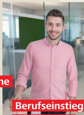
Berufseinstieg bei der EVN

Nach Abschluss Ihrer theoretischen Ausbildung und mit ersten praktischen Erfahrungen können Sie bei uns ins Berufsleben einsteigen und voll durchstarten.