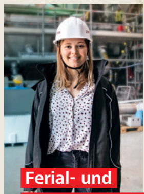
Ferial- und Berufspraktika

Berufserfahrungen sammeln, spannende Tätigkeiten kennenlernen und Engagement unter Beweis stellen: Die EVN bietet Ferial- bzw. Berufspraktika für Schüler*innen und Student*innen.