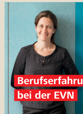
Berufserfahrung bei der EVN

Sie bringen wertvolle Berufserfahrung aus unterschiedlichen Branchen und Unternehmen mit und suchen neue Herausforderungen? Dann sind Sie bei uns genau richtig!