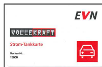
Abbildung 4: EVN Strom-Tankkarte