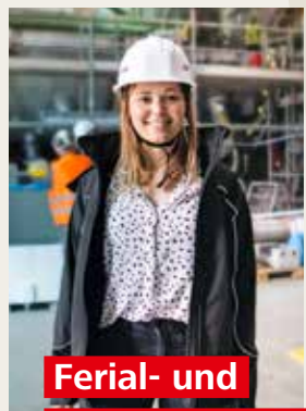
Ferial- und Berufspraktika

Berufserfahrungen sammeln, spannende Tätigkeiten kennenlernen und Engagement unter Beweis stellen: Die EVN bietet Ferial- bzw. Berufspraktika für Schülerinnen, Schüler und Studierende.