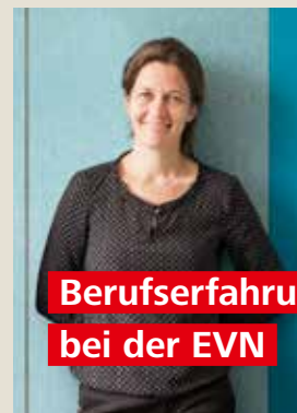
Berufserfahrung bei der EVN

Sie bringen wertvolle Berufserfahrung aus unterschiedlichen Branchen und Unternehmen mit und suchen neue Herausforderungen? Dann sind Sie bei uns genau richtig!