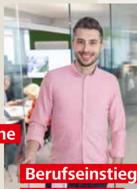
Berufseinstieg bei der EVN

Nach Abschluss Ihrer theoretischen Ausbildung und mit ersten praktischen Erfahrungen können Sie bei uns ins Berufsleben einsteigen und voll durchstarten.