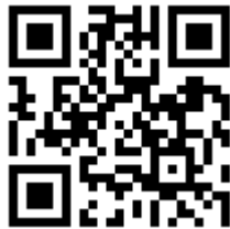
Abbildung 3: QR Code zum Download der App Autoladen 2.0

Die App ist für Google Android (ab Version 6.0) und Apple iOS Geräte (ab Version 8.0) kostenlos im jeweiligen App Store herunterladbar.