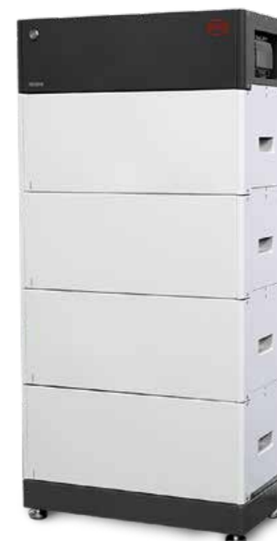
Eine Batterie macht unabhängig und Ihre Gemeinde flexibler in der Energienutzung.