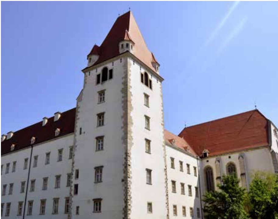
1260 wurde die Burg in Wiener Neustadt urkundlich erstmalig erwähnt, 759 Jahre danach auf EVN Naturwärme umgestellt.

Während Europa über den Klimaschutz spricht, wird in Wiener Neustadt gehandelt: Militärakademie und HTL beziehen CO 2 -neutrale Naturwärme aus Biomasse.